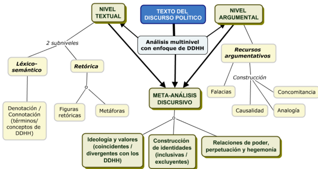
Mapa 1 Estructura de análisis de discurso multinivel con enfoque de derechos humanos para discursos políticos en textos

A partir de los insumos desarrollados en el apartado anterior, en primer lugar, se ilustra con el Mapa 1 , los niveles de análisis del discurso (como género ) político (que es el sub-género ) escrito (la modalidad del discurso), y los diversos subniveles, recursos discursivos y características a analizar. Además, el Cuadro 1 establece los criterios y categorías de análisis para comprender el análisis con EDH: